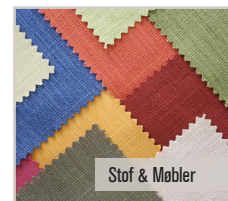
Stof & Møbler