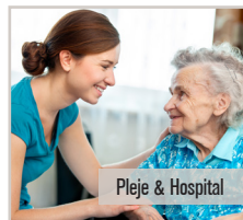
Pleje & Hospital