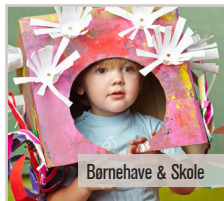
Børnehave & Skole