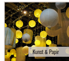
Kunst & Papir